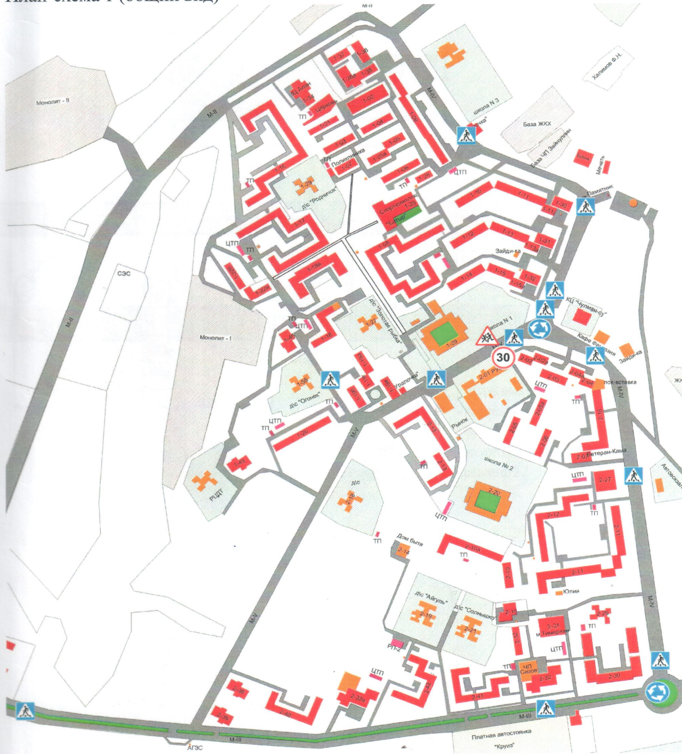
План-схема 1 (общий вид)